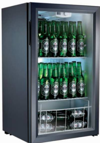
※製品データ写真のため、冷蔵庫内の飲料は実物と異なります